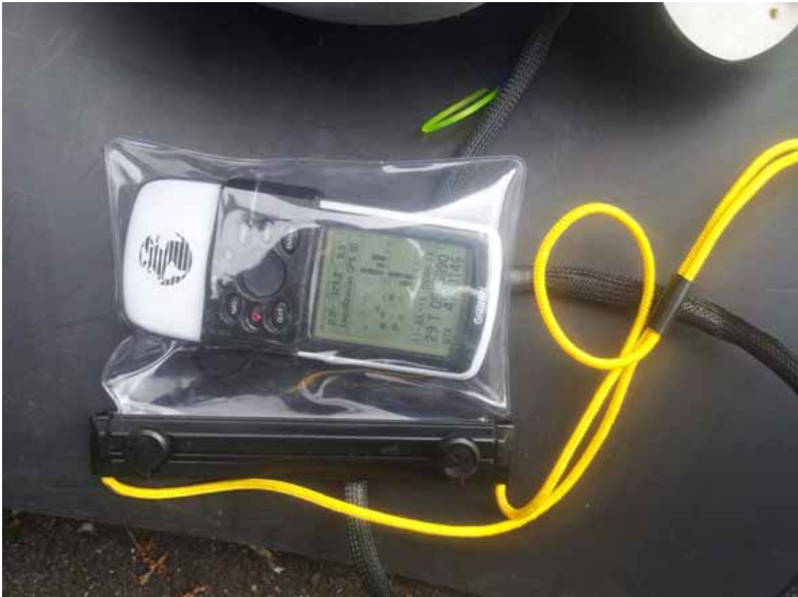
Equipo estanco para 50 m.